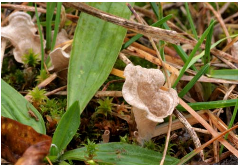
Fot. 5. Języczek strefowany ( Arrhenia spathulata ), ID: 156634. Fot. Waldemar Czerniawski.

1. Kobierzyce, pow. wrocławski, DS, N2000 „Grądy Odrzańskie”, BE-68; 01.05.2009; las liściasty; złom drzewa liściastego; TP; zieln. (ZBŚRiL PAN, 7/TP/8.05.09); ID: 130093. 2. Siechnice, pow. wrocławski, DS, N2000 „Grądy Odrzańskie”, CE-50; 01.05.2009; las liściasty; gałąź drzewa liściastego; TP; zieln. (ZBŚRiL PAN, 8/TP/8.05.09); ID: 130088.