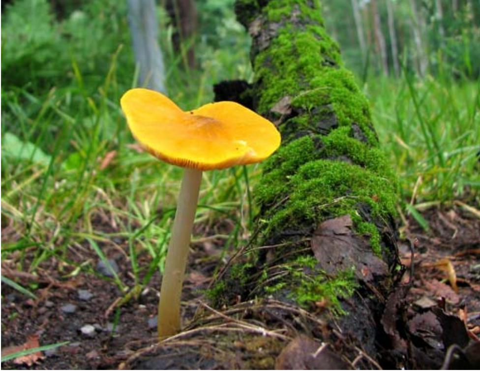
Fot. 15. Droбноłuszczak żółtawy ( Pluteus leoninus ), ID: 138843.