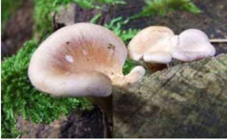
Fot. 12. Twardziak muszlowy ( Lentinus torulosus ), ID: 130923.

09.09.2008, 21.06.2009; las liściasty; pniak brzozy; BK; fot., zieln. (ZBŚRiL PAN, 3/BK/17.06.09, 7/BK/31.07.09); ID: 130923 (Fot. 12.), 136804. 3. Ruda, 1 km E, pow. radomszczański, LD, DE-46; 20.09.2009; las mieszany; pniak brzozy; JN; fot., zieln. (ZBŚRiL PAN, 4/JN/15.10.09); ID: 146831. 4. Szczukocice, 1 km S, pow. piotrkowski, LD, DE-47; 10.10.2009; las mieszany; pniak brzozy; JN; fot., zieln. (ZBŚRiL PAN, 2/JN/8.11.09); ID: 149522. 5. Łęg, 2 km S, pow. częstochowski, SL, DE-54; 05.07.2009; las sosnowy; pniak brzozy; JN; fot., zieln. (ZBŚRiL PAN, 12/JN//31.07.09); ID: 136891. 6. Kijów, 1 km S, pow. częstochowski, SL, DE-54; 05.07.2009; las mieszany; pniak brzozy; JN; fot., zieln. (ZBŚRiL PAN, 13/JN//31.07.09); ID: 136892. 7. Kijów, 1 km W, pow. częstochowski, SL, DE-54; 05.07.2009; las mieszany; pniak brzozy; JN; fot., zieln. (ZBŚRiL PAN, 14/JN//31.07.09); ID: 136898. 8. Kijów, 1,8 km SW, pow. częstochowski, SL, DE-54; 05.07.2009; mieszany skraj lasu; pniak brzozy; JN; fot., zieln. (ZBŚRiL PAN, 15/JN//31.07.09); ID: 136899. 9. Dąbrówka, 2 km NW, pow. radomszczański, LD, DE-55; 20.06.2009; las sosnowo-brzozowy; pniak brzozy; JN; fot., zieln. (ZBŚRiL PAN, 10/JN//31.07.09); ID: 135281. 10. Lipie, 0,8 km NW, pow. radomszczański, LD, DE-55; 21.06.2009; las sosnowy; pniak brzozy; JN; fot., zieln. (ZBŚRiL PAN, 11/JN//31.07.09); ID: 135284. 11. między dz. Radomsko-Wy-