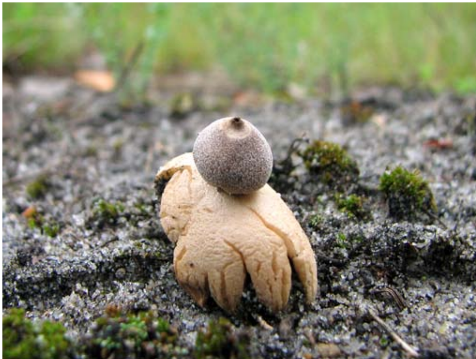
Fot. 9. Gwiazdosz najmniejszy ( Geastrum minimum ), ID: 138837.

las mieszany; ziemia; JN; fot., zieln. (ZBŚRiL PAN, 16/JN/1.08.09); ID: 134485, 149881. 2. Ruciane-Nida, 7 km S, pow. piski, WM, N2000 „Puszcza Piska”, EB-69; 24.08.2009; las iglasty; ziemia; MPa; fot.; ID: 151369.