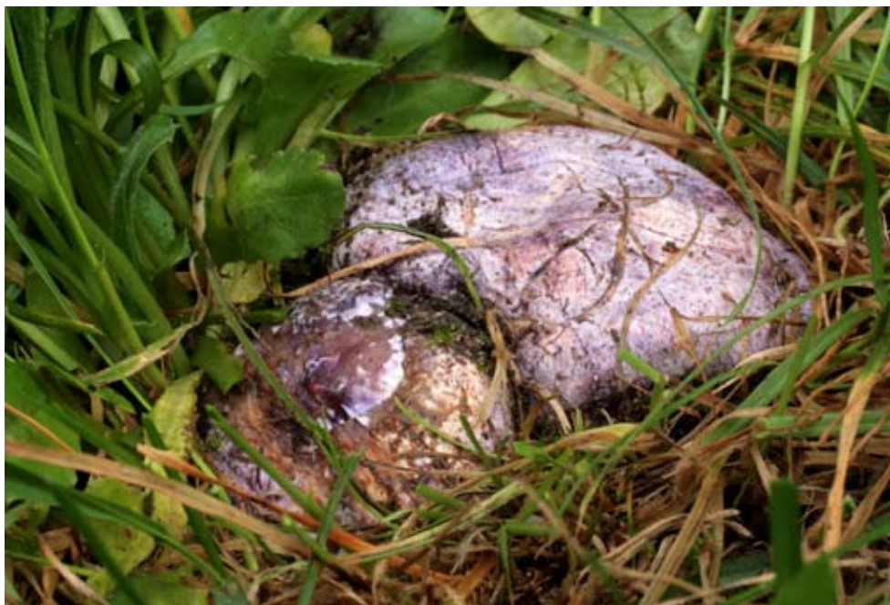
Fot. 14. Sromotnik fiołkowy ( Phallus hadriani ), ID: 157096.