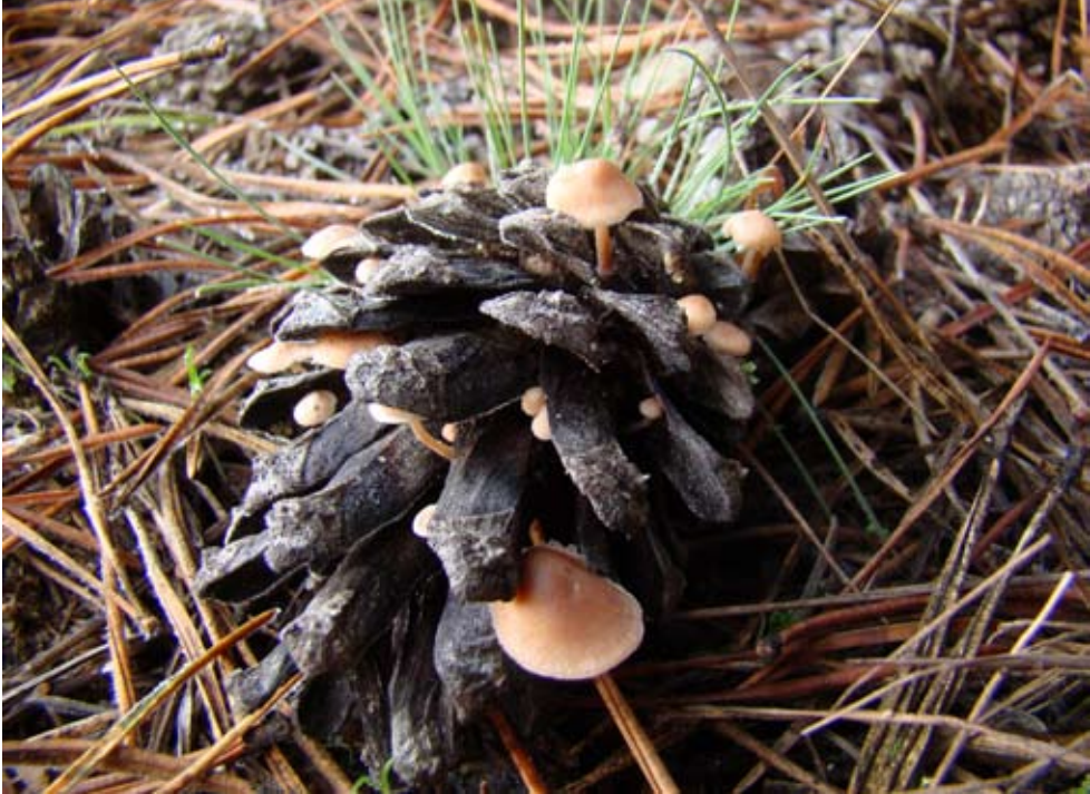
Fot. 6. Pieniężniczka szyszkowa ( Baeospora myosura ), ID: 151253.