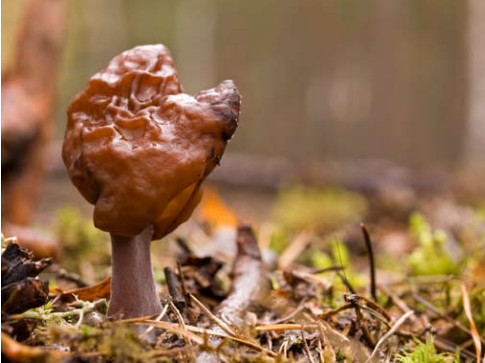
Fot. 3. Gyromitra ambigua , ID: 131262. Fot. Robert Puciata.

drewno sosny; MG; AK; fot., zieln. (ZBŚRiL PAN, 6/MG/19.10.09); ID: 145931.