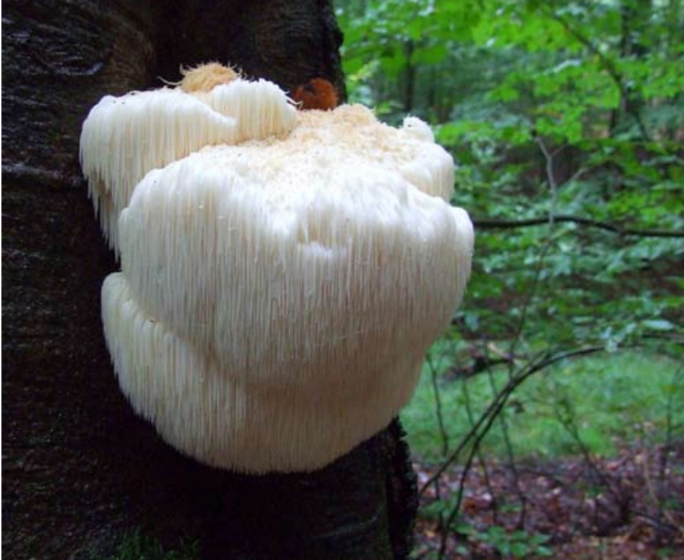
Fot. 11. Soplówka jeżowata ( Hericium erinaceum ), ID: 152131.