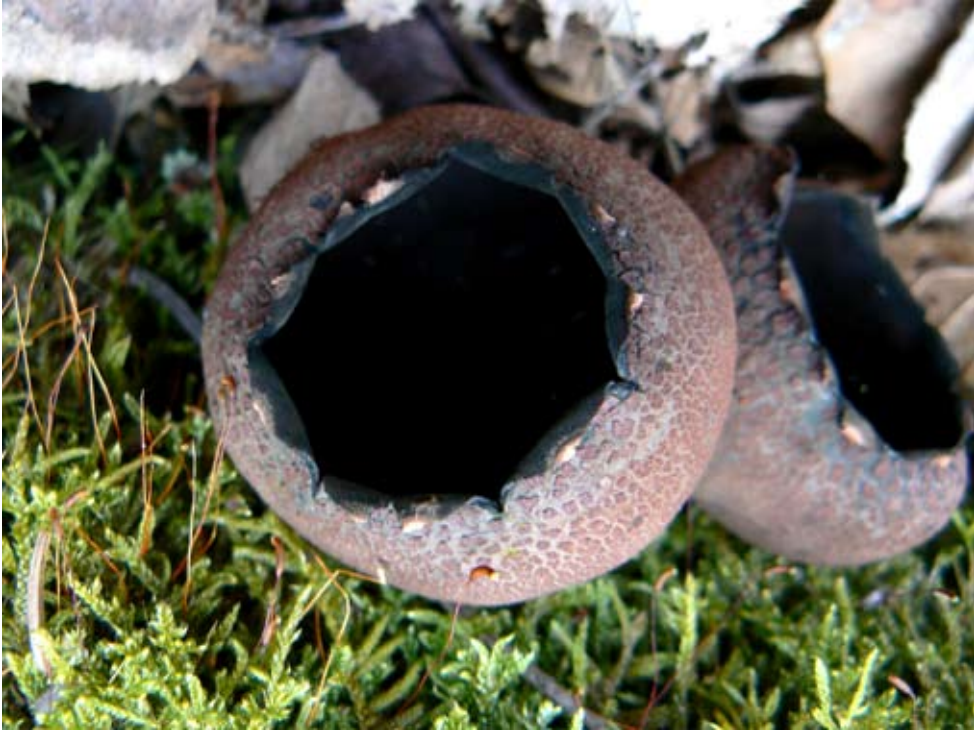
Fot. 4. Urnula craterium , ID: 128698.

nadl. Maskulińskie, oddz. 122, N2000 „Puszcza Piska”, EB-69; 15.04.2009; las miesza-ny; gałąź leszczyny; MPa; fot., zieln. (ZBŚRiL PAN, 1/MP/30.04.09); ID: 128699.