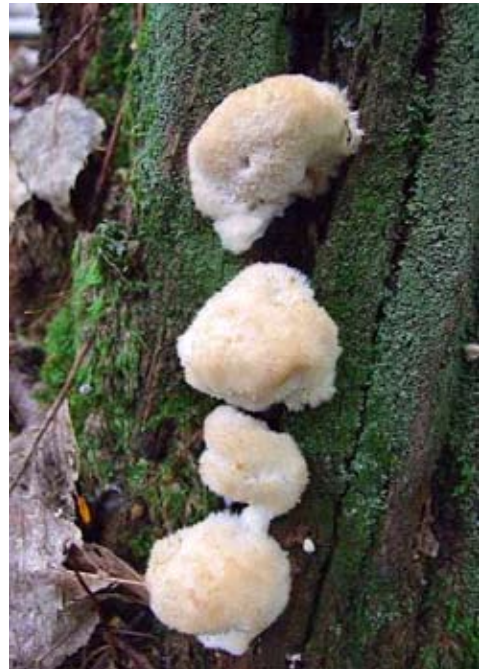
Fot. 13. Drobnoporek sproszkowany ( Oligoporus ptychogaster ), ID: 150052.

NW, pow. gnieźnieński, WP, nadl. Czerniejewo, oddz. 113, CC-92; 27.09.2009; las mieszany; pniak świerka; BK; fot., zieln. (ZBŚRiL PAN, 5/BK/10.11.09); ID: 149184. 3. Borowa, 1,7 km NE, pow. radomszczański, LD, DE-35; 19.10.2009; las mieszany; pniak świerka; JN; fot., zieln. (ZBŚRiL PAN, 12/JN/8.11.09); ID: 150089. 4. Prusicko, pow. pajęczański, LD, 2 km SE, DE-54; 03.10.2009; las iglasty; pniak świerka; JN; fot., zieln. (ZBŚRiL PAN, 19/JN/15.10.09); ID: 147919. 5. Łęg, 2 km S, pow. częstochowski, SL, DE-55; 26.09.2009; las sosnowy; kłoda sosny; JN; fot., zieln. (ZBŚRiL PAN, 18/JN/15.10.09); ID: 147319. 6. Piekielnik, pow. nowotarski, MP, DG-38; 13.09.2009; las świerkowo-jodłowy; pniak iglasty; APK; fot., zieln. (ZBŚRiL PAN, 7/APK/1.12.09); ID: 150761. 7. 2,5 km N od przystanku PKS Czółnowo, pow. białostocki, PD, PKPK, N2000 „Puszcza Knyszyńska”, GC-02; 11.09.2009; las mieszany; drewno