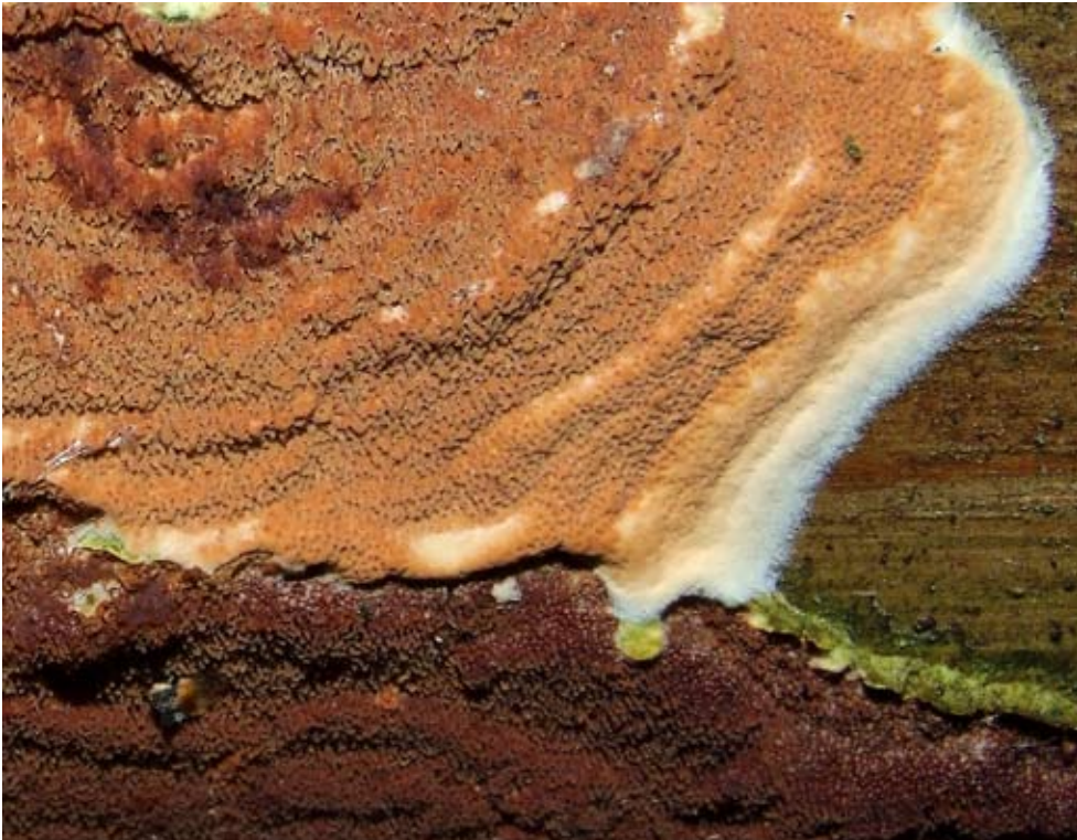
Fot. 10. Klejoporek winnoczerwony ( Gloeoporus taxicola ), ID: 123464.

1. Binowo, 2,1 km SW, pow. gryfiński, ZP, SzPKPB, N2000 „Wzgórza Bukowe”, AB-93; 04.01.2009; las mieszany; gałąź sosny; GD; fot., zieln. (ZBŚRiL PAN, 6/GD/26.02.09); ID: 123464 (Fot. 10.). 2. Binowo, 4 km NW, pow. gryfiński, ZP, SzPKPB, N2000 „Wzgórza Bukowe”, AB-93; 18.01.2009; las mieszany; kłoda sosny; GD; fot., zieln. (ZBŚRiL PAN, 9/GD/26.02.09); ID: 124495. 3. 0,5 km SW od strzelnicy wojskowej, pow. gryfiński, ZP, SzPKPB, N2000 „Wzgórza Bukowe”, AB-93;