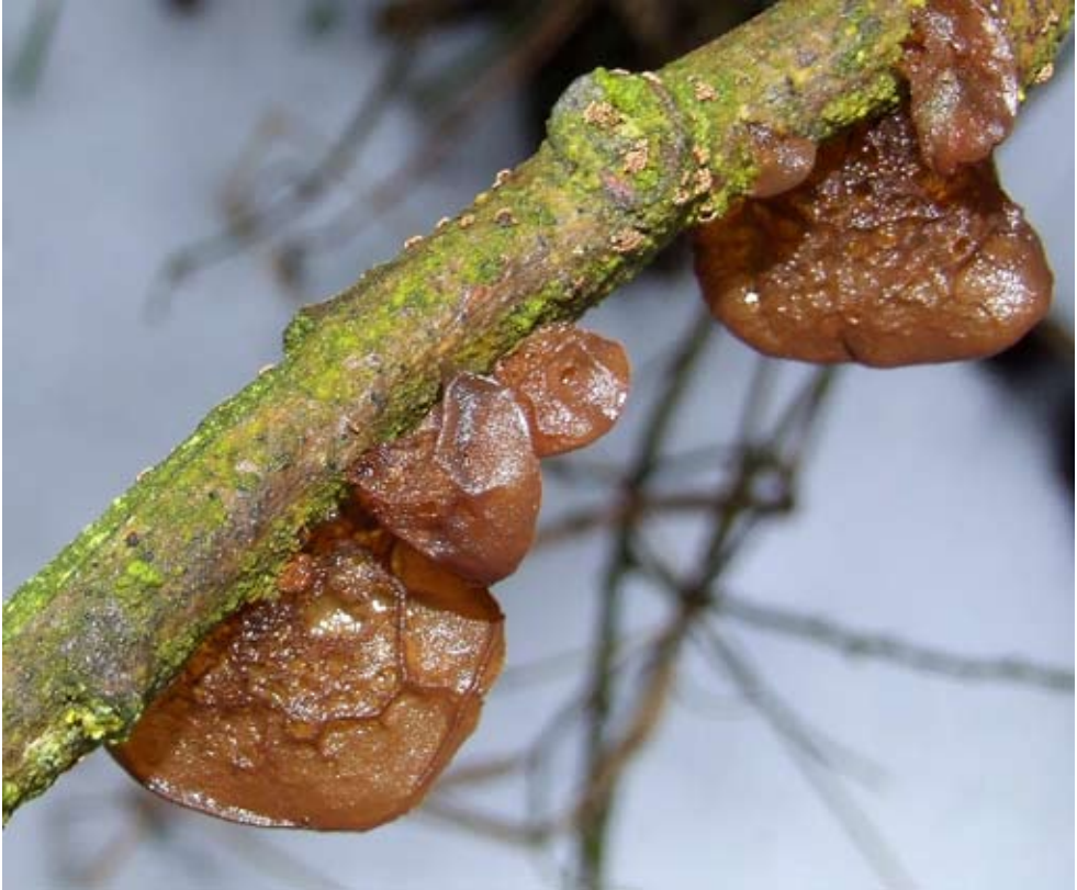
Fot. 8. Kisielnica wierzbowa ( Exidia recisa ), ID: 125771.

łęzie wierzby; GD; fot., zieln. (ZBŚRiL PAN, 1/GD/25.02.09); ID: 123376. 7. Dobropole Gryfińskie, 0,5 km SW, pow. gryfiński, ZP, SzPKPB, N2000 „Wzgórza Bukowe”, AB-94; 28.12.2008; łozowisko; gałęzie wierzby; GD; fot., zieln. (ZBŚRiL PAN, 2/GD/25.02.09); ID: 123377. 8. Glinna, 2 km SE, pow. gryfiński, ZP, SzPKPB, N2000 „Wzgórza Bukowe”, AB-94; 26.01.2009; łozowisko; gałęzie wierzby; GD; fot., zieln. (ZBŚRiL PAN, 19/GD/26.02.09.); ID: 125149. 9. Glinna, 1,7 km SE, pow. gryfiński, ZP, SzPKPB, N2000 „Wzgórza Bukowe”, AB-94; 26.01.2009; łozowisko; gałęzie wierzby; GD; fot., zieln. (ZBŚRiL PAN, 20/GD/26.02.09); ID: 125151. 10. Stare Czarnowo, 1,9 km W, pow. gryfiński, ZP, SzPKPB, N2000 „Wzgórza Bukowe”, AB-94; 13.11.2009; łozowisko