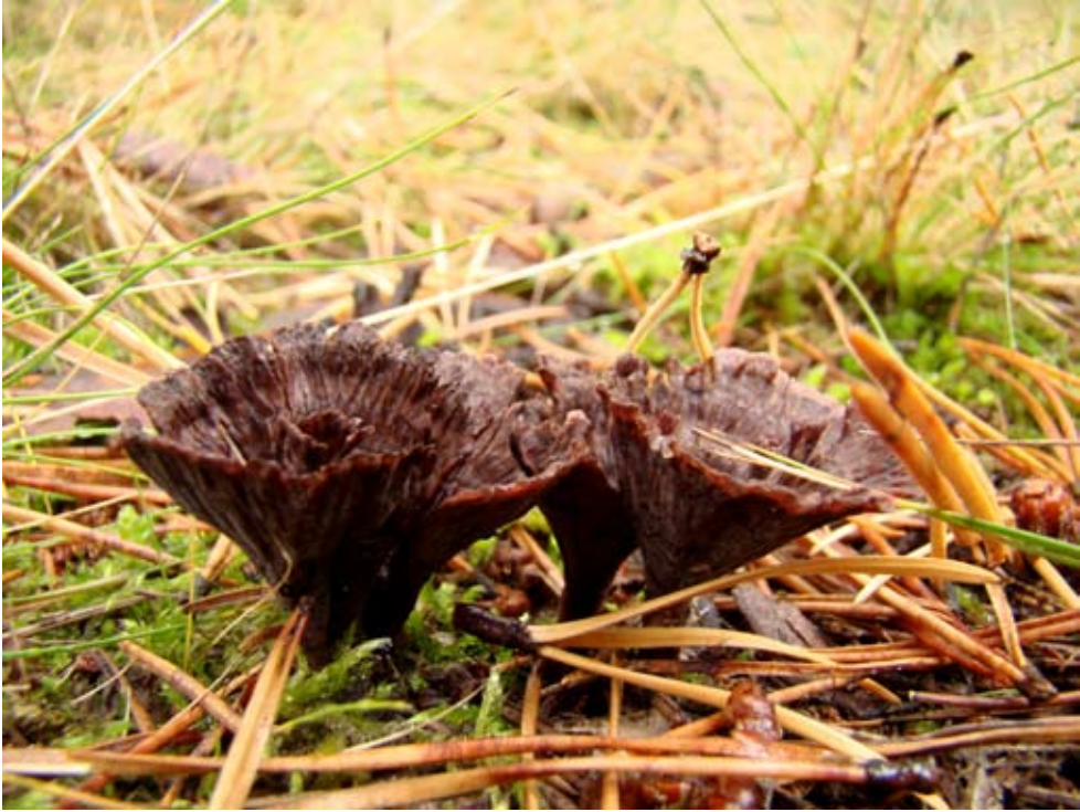
Fot. 16. Chropiatka lejkwata ( Thelephora caryophylla ), ID: 150091.

10/GD/18.04.09); ID: 126694. 5. Dobropole Gryfińskie, 1,8 km NW, pow. gryfiński, ZP, SzPKPB, N2000 „Wzgórza Bukowe”, AB-94; 17.10.2009; las mieszany; kłody brzozy; GD; fot. zieln. (ZBŚRiL PAN, 8/GD/29.12.09); ID: 152151. 6. Poznań-Nowa Wieś Dolna, 0,6 km NW, pow. Poznań, WP, BC-99; 14.10.2009; las mieszany; gałąź drzewa liściastego; BK; fot., zieln. (ZBŚRiL PAN, 3/BK/10.11.09); ID: 149155. 7. Siechnice, 2 km N, pow. wrocławski, DS, N2000 „Grądy w Dolinie Odry” i „Grądy Odrzańskie”, BE-59; 28.03.2009; zdrzewienie (drzewa liściaste); gałąź drzewa liściastego; TP; zieln. (ZBŚRiL PAN, 1/TP/8.05.09); ID: 129103. 8. Sobótka, 1,5 km S, Masyw Ślęży, pow. wrocławski, DS, ŚPK, N2000 „Masyw Ślęży”, BE-76; 01.01.2009; las mieszany; gałąź brzozy; TP; zieln. (ZBŚRiL PAN, 3/TP/8.05.09); ID: 123133. 9. Gdańsk, Dol. Radości, pow.