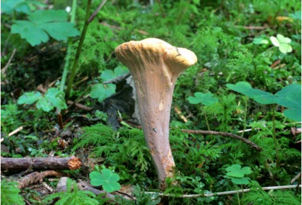
Fot. 7. Buławka obcięta ( Clavariadelphus truncatus ), ID: 157470.

EF-91; 31.10.2009; zadrzewienie śródpolne; pniak topoli; APK; fot., zieln. (ZBŚRiL PAN, 9/APK/1.12.09); ID: 153718. 6. 1,5 km W od przystanku PKS Czółnowo, pow. białostocki, PD, PKPK, N2000 „Puszcza Knyszyńska”, GC-02; 11.09.2009; las mieszany; pień; MG; fot., zieln. (ZBŚRiL PAN, 2/MG/19.10.09); ID: 145919. 7. 0,8 km N od przystanku PKS Czółnowo, pow. białostocki, PD, PKPK, N2000 „Puszcza Knyszyńska”, GC-02; 11.10.2009; las mieszany; kłoda; MG; fot., zieln. (ZBŚRiL PAN, 5/MG/23.11.09); ID: 149156. 8. Ciasne 0,4 km N, pow. białostocki, PD, GC-11; 27.06.2009; las sosnowy; konar sosny; MG; fot., zieln. (ZBŚRiL PAN, 1/MG/19.10.09); ID: 145915. 9. Izoby, pow. białostocki, PD, PKPK, N2000 „Puszcza Knyszyńska”, GC-12; 17.08.2009; las mieszany; kłoc drewna; MG; fot., zieln. (ZBŚRiL PAN, 22/MG/15.10.09); ID: 145917.