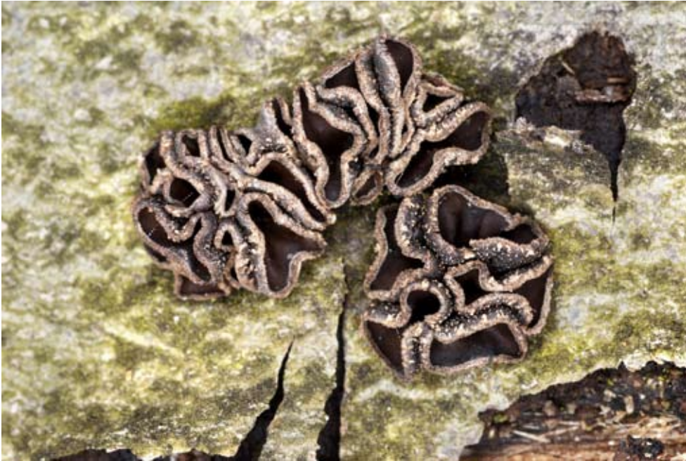
Fot. 2. Orzechówka wiązkowa ( Encoelia fascicularis ), ID: 156821.

59; 28.03.2009; zadrzewienie osikowe; kłoda osiki; TP; fot., zieln. (ZBŚRiL PAN, 10/TP/8.05.09); ID: 129102 (Fot. 2). 2. Lubogóra, 2 km SW, pow. świebodziński, LS, AD-28; 16.01.2005; las liściasty; gałąź; TŚ; fot., zieln. (TŚ, 108); ID: 156821.