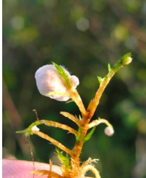
Fot. 1. Języczek siatkowany Arrhenia retiruga , ID: 207969.

1. Złoty Potok, pow. częstochowski, SL, rez. „Parkowe”, DE-95; 21.08.2011; buczyna; ziemia; KKo; fot., zieln. (BGF/BF/KK/110821/0003); ID: 190321. 2. Bystrzanowice-Dwór, pow. częstochowski, SL, rez. „Bukowa Kępa”, DE-96; 15.08.2011; buczyna; ziemia; KKo; fot., zieln. (BGF/BF/KK/110815/0001); ID: 189645.