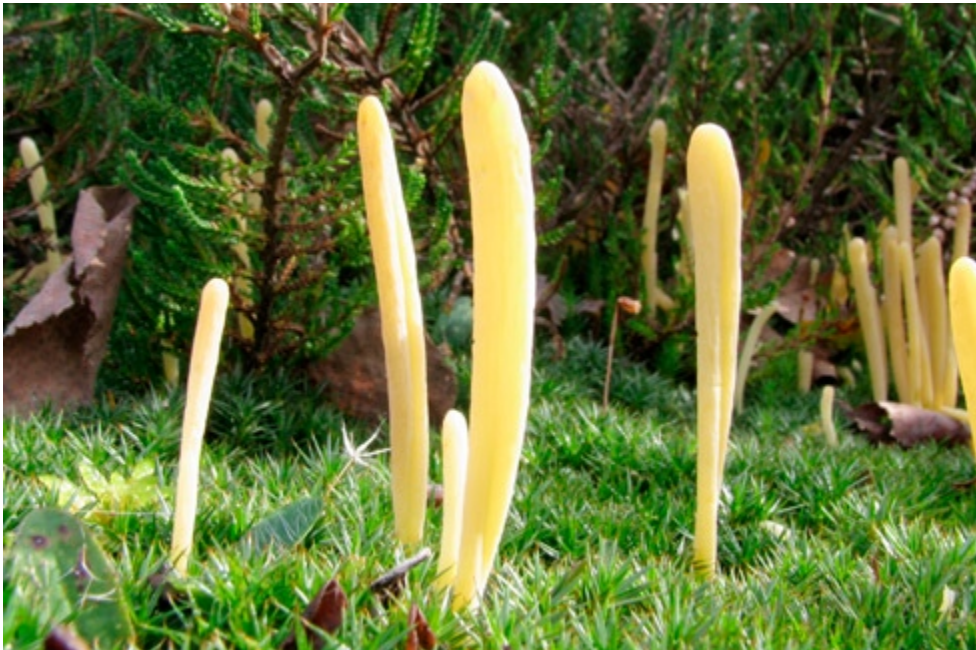
Fot. 4. Goździeniec gliniasty Clavaria argillacea , ID: 207109.

1. Skawina-Korabniki, pow. krakowski, MP, DF-79; 15.10.2011; łąka; ziemia; WCz; fot., zieln. (BGF/BF/WCz/111015/0004); ID: 197360.