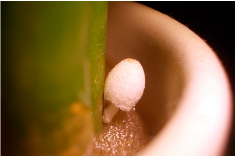
Fot. 5. Coprinus kubickae , ID: 198014.

Coprinus megaspermus P.D. Orton (= Parasola megasperma (P.D. Orton) Redhead, Vilgalys & Hopple); BwCL