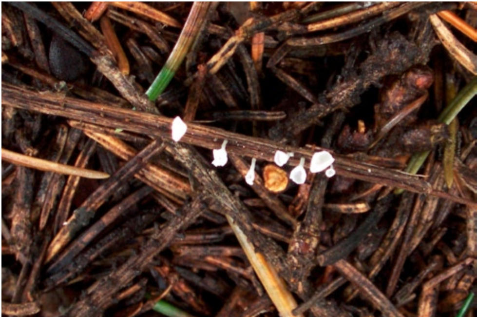
Fot. 3. Miseczniczka łodygowa Calyprella capula , ID: 74403.