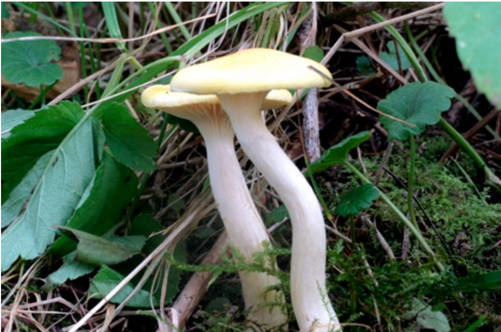
Fot. 11. Wodnicha modrzewiowa Hygrophorus lucorum , ID: 180105.