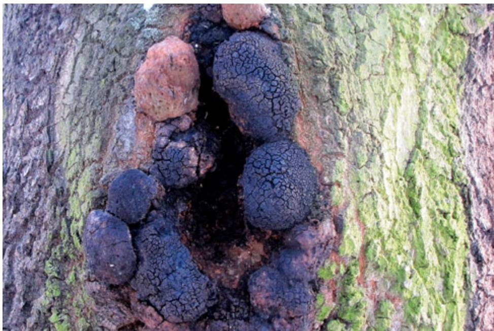
Fot. 14. Inonotus nidus-pici , ID: 181981.