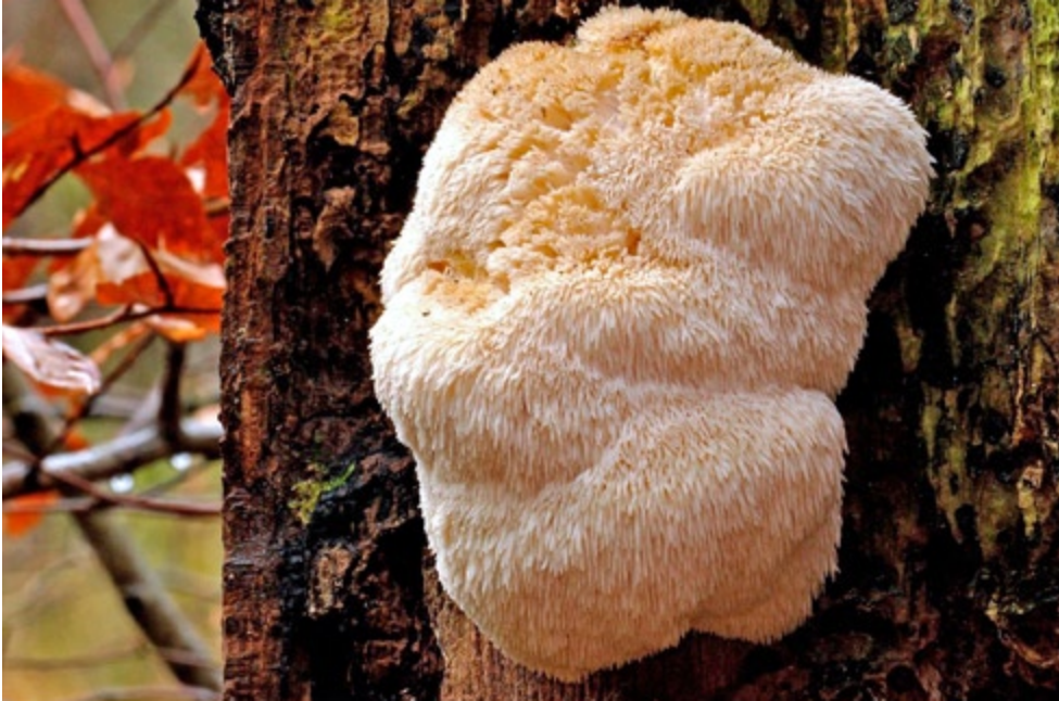
Fot. 22. Soplówka jeżowata Hericium erinaceum . ID: 207633.

G. fimbriatum (201473, 204333, 208507); G. striatum (208351, 208964); G. triplex (197537, 204876, 207556, 208832); Gomphus clavatus (202364), Grifola frondosa (207817, 208828), Gyrodon lividus (194873); Hericium erinaceum (207633-fot. 22), Hydnellum compactum (195712); H. caeruleum (203861), Mitrula paludosa (201879), Morchella conica (198700); M. esculenta (198546); M. gigas (198545); Mutinus ravenelii (201086, 208673); Pluteus petasatus (208526); P. umbrosus (208709); Pulveroboletus lignicola (202742), Sarcodon squamosus (208833), Steccherinum fimbriatum (196646, 208990); Tulostoma fimbriatum (195933, 208527, 208958).