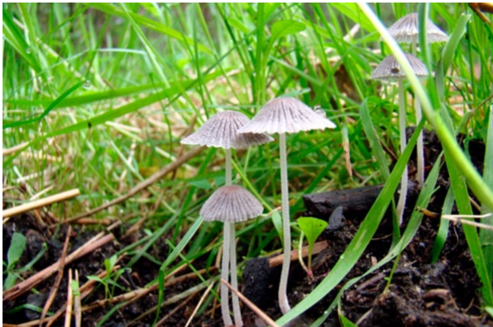
Fot. 6. Coprinus plagioporus , ID: 195717. Fot. Jacek Nowicki.

2. Gdańsk-Oliwa, pow. Gdańsk, PM, TPK, Dol. Samborowo, DA-80; 07.12.2011; łęg; zagrzebane drewno; MWR; BG; fot., zieln. (BGF/BF/MWR/111207/0001); ID: 196247.