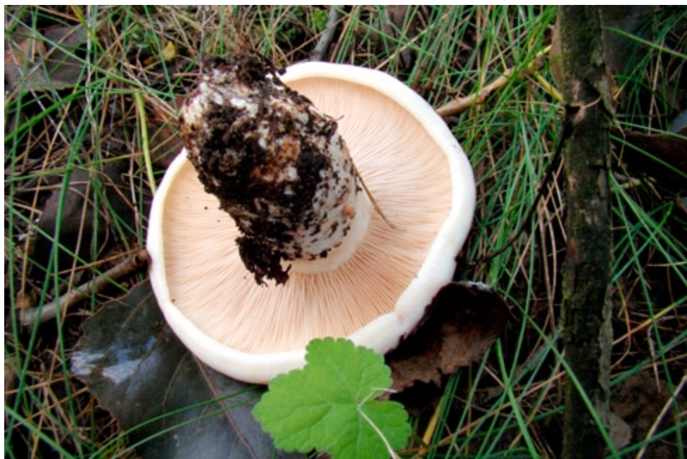
Fot. 15. Mleczaj różowoblaszkowy Lactarius controversus . ID: 172758.

1. Pow. wadowicki, MP, PKBM, Beskid Mały, Praciaki, DF-95; 11.08.2007; buczyna