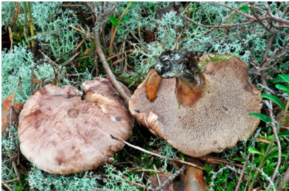
Fot. 19. Sarniak sinostopy Sarcodon glaucopus . ID: 207809.