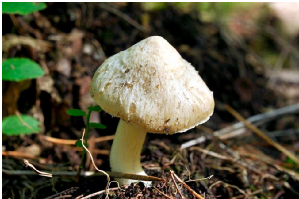
Fot. 13. Strzępiak bzowy Inocybe sambucina . ID: 207332.