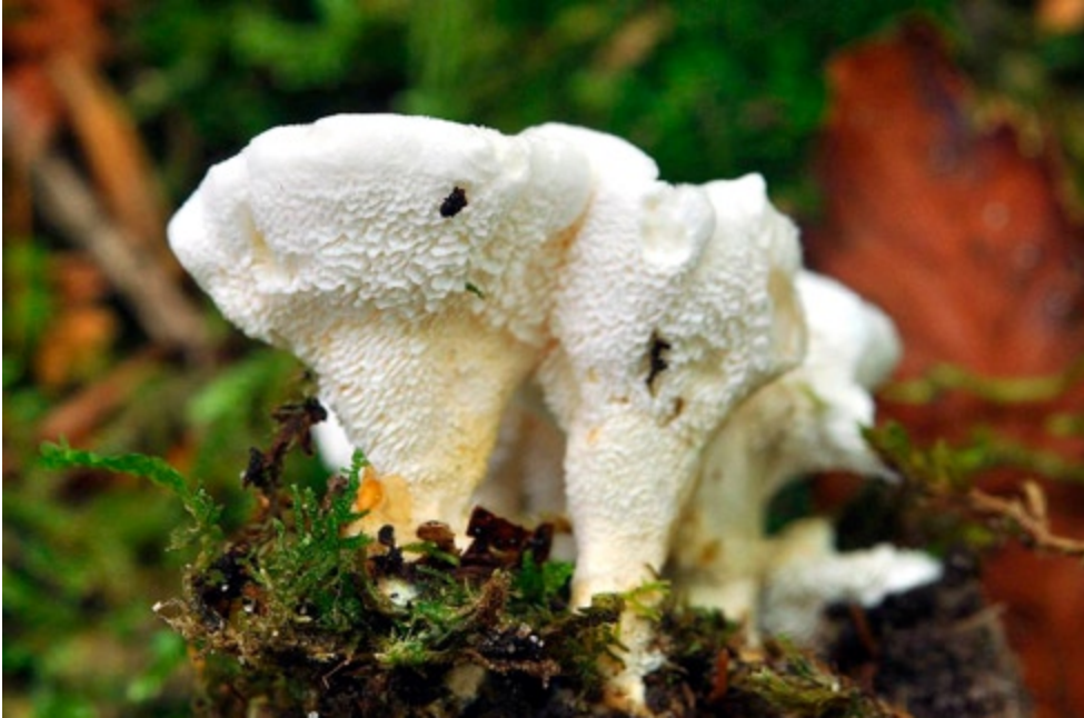
Fot. 20. Wielozarodniczka kapeluszkowa Sistotrema confluens . ID: 207805.