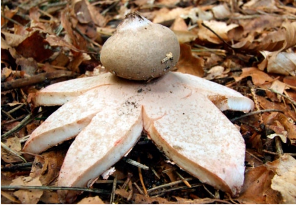
Fot. 9. Gwiazdosz rudawy Geastrum rufescens , ID: 204879.