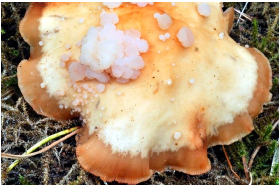
Fot. 21. Syzygospora tumefaciens . ID: 201451.