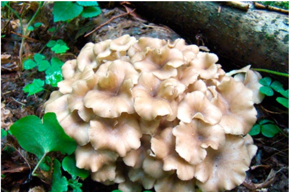
Fot. 17. Żagiew wielogłowa Polyporus umbellatus . ID: 196491.