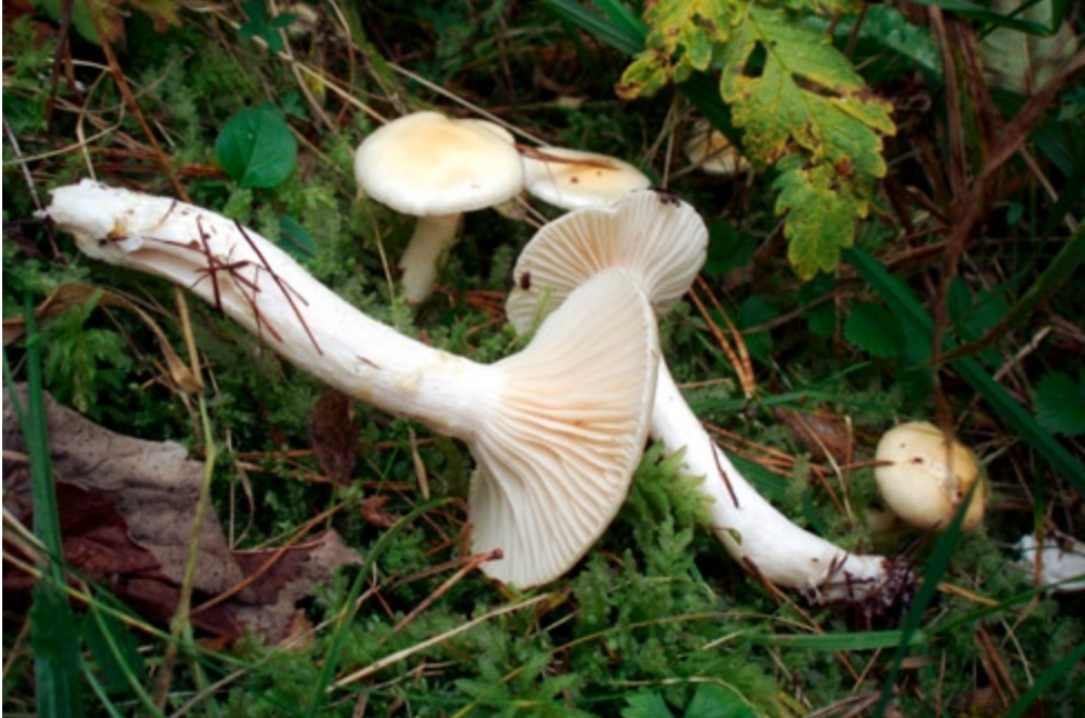
Fot. 10. Wodnicha grubopięścieniowa Hygrophorus gliocyclus , ID: 79058.