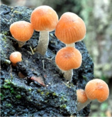
Fot. 18. Psathyrella tenuicula . ID: 201853.

a łąką; ziemia; BK; BG; zieln. (BGF/BF/BK/100522/0002); ID: 197483.