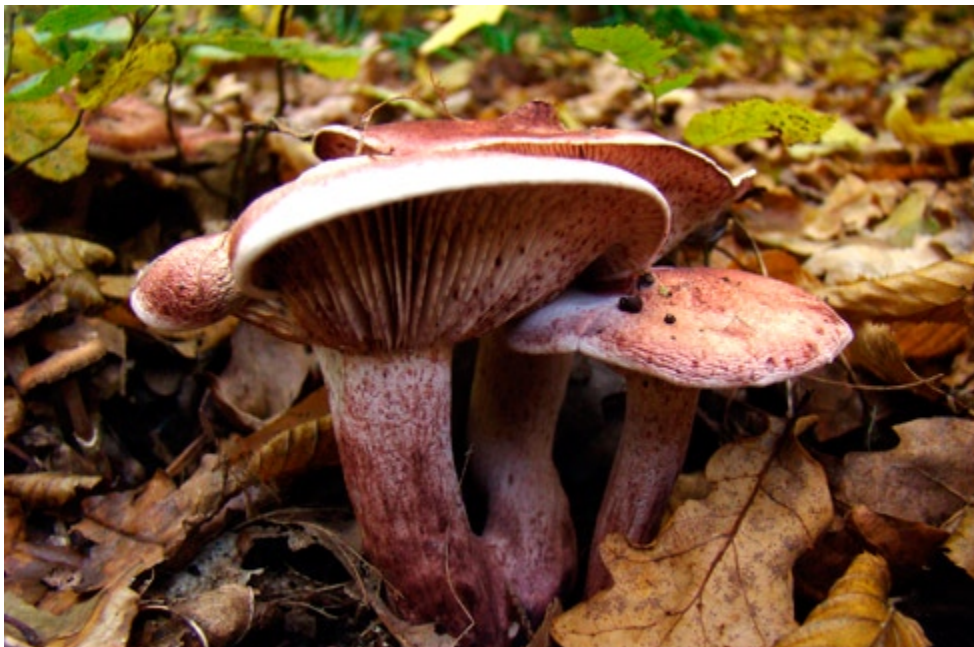
Fot. 12. Wodniczka gołąbkowa Hygrophorus russula . ID: 181589.

3. Bożacin, 1 km NNE, pow. zniński, KP, Nadl. Gołąbki, leśn. Mięcierzyn, oddz. 180, CC-73; 03.05.2011; łozowisko w lesie mieszanym; gałęzie wierzby; BK; fot., zieln. (ZBŚRiL PAN, 7/BK/2.02.12); ID: 195052.