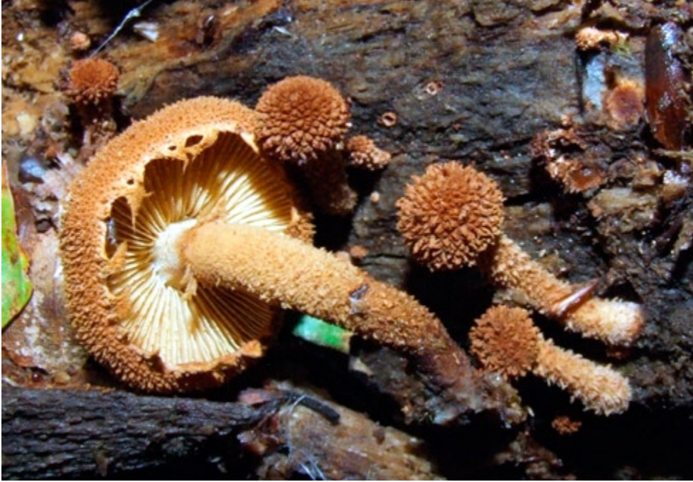
Fot. 8. Płomienniczek żółtobrązowy Flammulaster muricatus , ID: 139257.