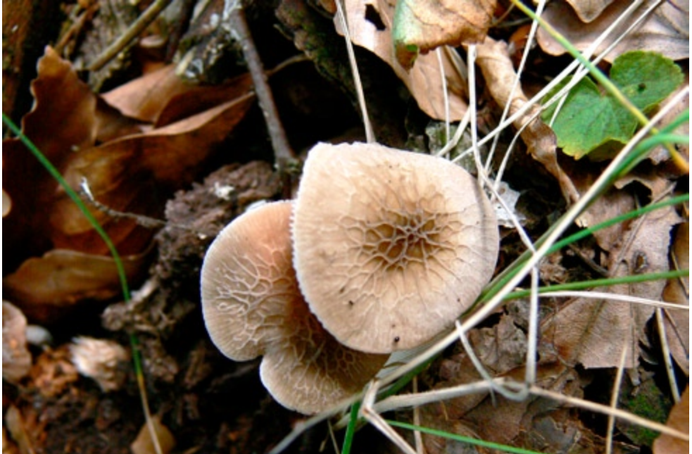
Fot. 16. Droбноłuszczak szarotrzonowy Pluteus thomsonii . ID: 189571.