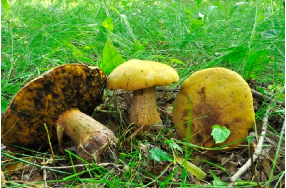
Fot. 2. Borowik ponury, forma żółtokapeluszowa Boletus luridus f. primicolor , ID: 169314.