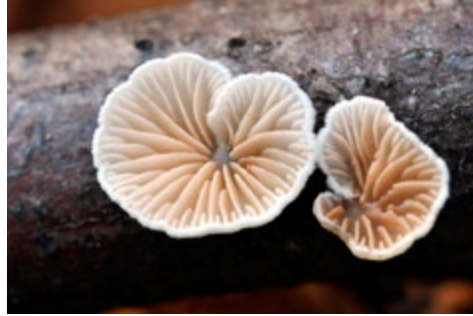
Fot. 7. Cizmówka ciemnoblaszkowa odmiana różowozarodnikowa Crepidotus cesatii var. subsphaerosporus , ID: 196949.

1. Gdańsk-Oliwa, pow. Gdańsk, PM, TPK, ok. ul. Michałowskiego, DA-80; 13.01.2012; las mieszany; gałęzie drzew liściastych; MWR; BG; fot., zieln. (BGF/BF/MWR/120113/0001); ID: 196949, (fot. 7).